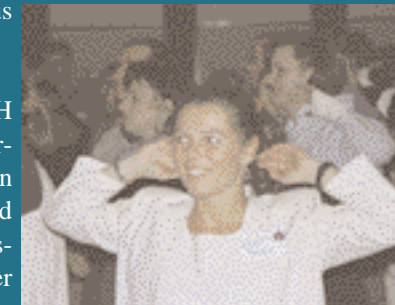
VORTRAG ZU GESUNDHEITSTHEMEN AUF EINEM GROSSSEMINAR

HEART & HEALTH, FRANKFURT AM MAIN TELEFON 069/96 20 07 00 TELEFAX 069/96 20 07 01 OFFICE@HEART-HEALTH.DE WWW.HEART-HEALTH.DE