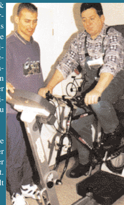
GESUNDHEITSBERATUNG ZUM THEMA HERZINFARKT/ HERZKREISLAUF-PRAVENTION IM RAHMEN EINER BETRIEBLICHEN GESUNDHEITSFÖRDERUNG IM PRODUZIERENDEN GEWERBE